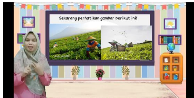
Gambar 1: Contoh Jenis-jenis pekerjaan

Sebelum mulai merancang media yang akan dikembangkan tentunya bahan-bahan yang akan digunakan di dalam pembuatan media dicari atau disiapkan terlebih dahulu. Contohnya seperti background , gambar, animasi, mentahan rekaman video, rekaman suara, musik pengiring dan sebagainya. Gambar-gambar yang disiapkan tentunya berkaitan dengan materi yang akan ditampilkan di dalam video pembelajaran. Contohnya gambar yang penulis gunakan untuk membuat media audio visual berbasis discovery learning dapat dilihat dari gambar 1 sebagai berikut :