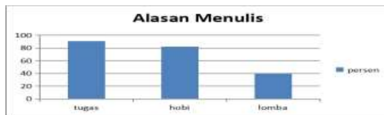
Diagram 3: Alasan menulis

Prosesnya kebanyakan berhenti sampai disini saja karena dosen tidak menindaklanjutinya setelah itu. Apakah tulisan atau makalahnya sesuai dengan kaidah penulisan atau tidak. Kondisi ini terjadi berkelanjutan, hal ini lah yang menyebabkan mahasiswa tidak tertantang untuk berkompetisi untuk di lomba-lomba jurnalistik yang ada. Sehingga hal inilah yang membuat mahasiswa kebingungan ketika membuat tugas akhir mereka atau skripsi. Mereka susah membuat tulisan yang betul-betul sesuai dengan kaedah pembuatan skripsi karena memang mereka belum terlatih untuk membuat karangan ilmiah.